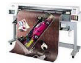
屋外用大型のサイン印刷機